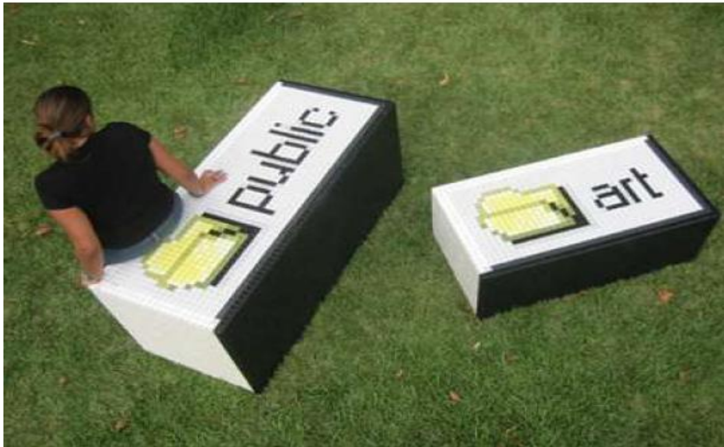
Xavi Muñoz. "PUBLIC ART" Instalación urbana. Técnica mixta:madera, pintura, mosaico vítreo, esmalte. Medidas variables. (PUBLIC: 70 x 145 x 58 cms/ ART: 44 x 104 x 58 cms) Barcelona 2003.