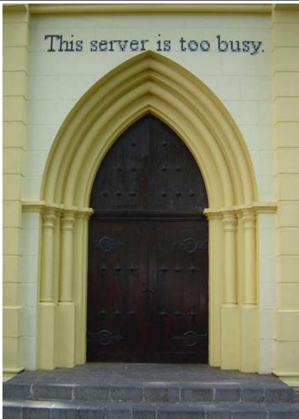
Xavi Muñoz. "THIS SERVER IS TOO BUSY" Instalación urbana. 25 x 350 cms. Santa Cruz de Tenerife 2005.