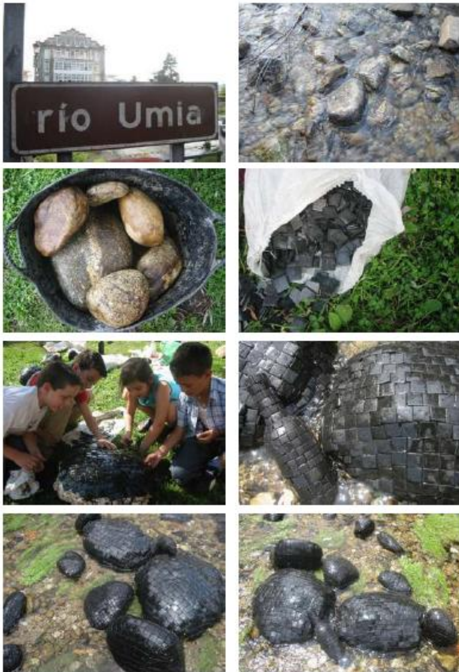
Xavi Muñoz. "SIN TITULO" Instalación en el río Umia, Galicia. Técnica mixta: piedras del río, objetos, mosaico vítreo. Medidas variables. Galicia 2003.