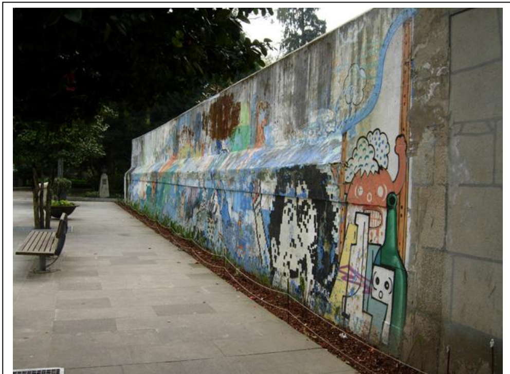
Plaza de las Baldosas, muro colindante al Asilo de ancianos de Caldas de Reis antes de ser intervenido