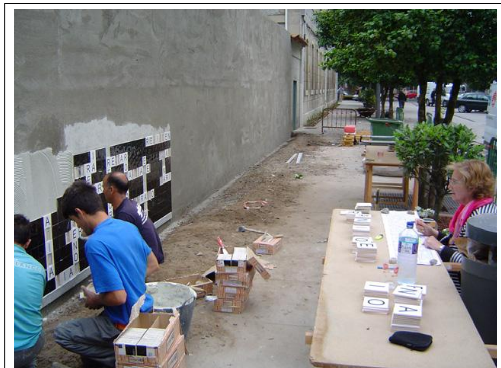
Primera etapa de producción del proyecto e instalación de las primeras baldosas.