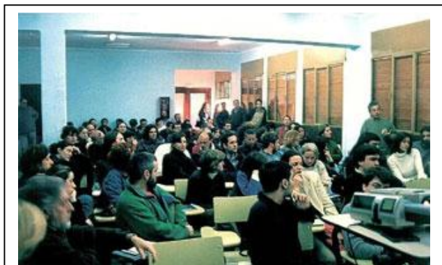
Debates en las antiguas oficinas de la Compañía Minera, 2000.

Los debates y propuestas vertidos en el encuentro sirvieron como un primer impulso