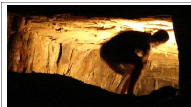
Diego Arribas. Fotografías, Mina Filomena, 2007.