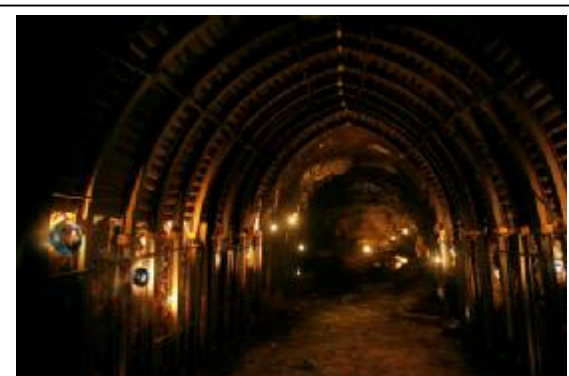
Carma Casulá. Instalación en Mina Filomena, 2007.