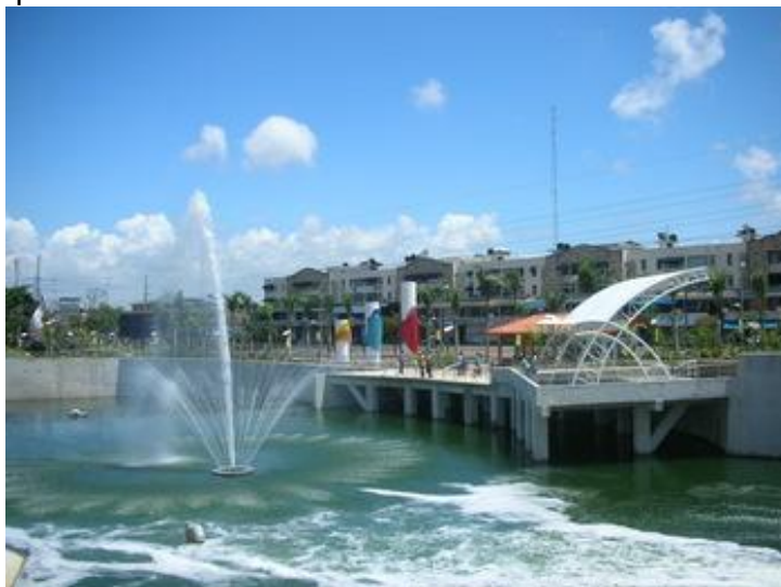
Conjunto Escultórico, Purificación Elemental