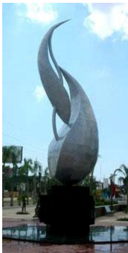
Nicolás Aracena Agua fragmentada Escultura en aluminio y mármol